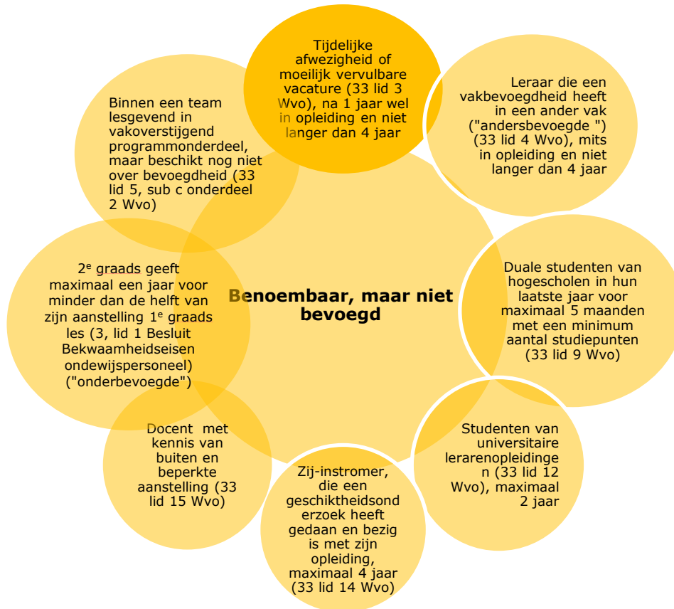
Figuur 3: Benoembaar, maar niet bevoegd

In de discussie over onbevoegdheid is het onderscheid tussen onbevoegde leraren en onbevoegd gegeven lessen belangrijk. Een leraar kan bevoegd zijn voor het geven van één vak in het vo, maar toch onbevoegd lesgeven. Dit is alleen toegestaan als hij binnen de wettelijke voorwaarden blijven om buiten zijn vak of graadgebied les te geven (zie figuur 3).