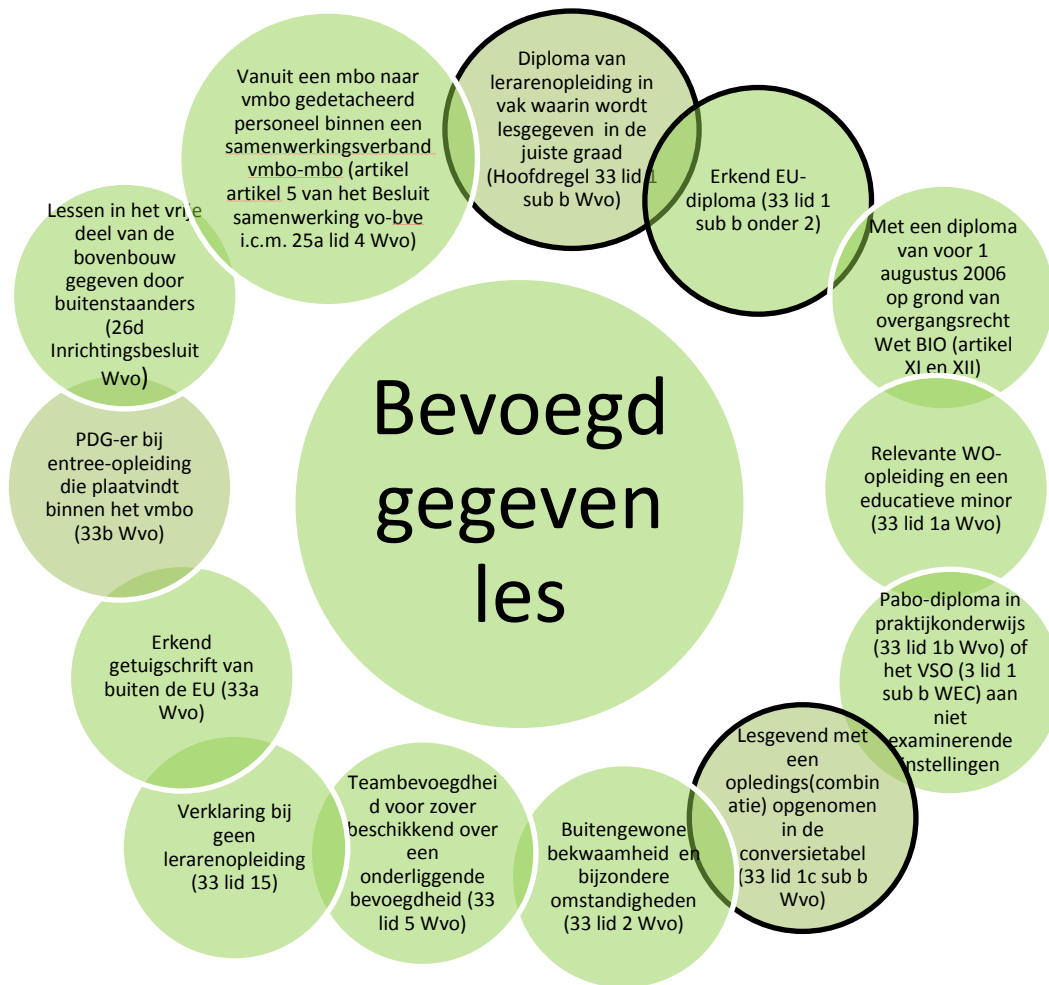
Figuur 4: Bevoegd

Leraren die lessen geven waarvoor niet een van de bovengenoemde benoemingsgrondslagen kan worden aangegeven, geven onbevoegd les. De onderstaande figuur geeft hiervan enkele voorbeelden.