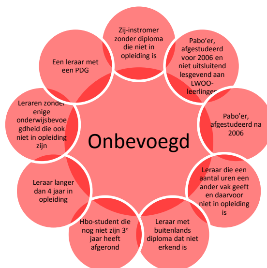
Figuur 5: onbevoegd (voorbeelden)

Leraren die lessen geven waarvoor niet een van de bovengenoemde benoemingsgrondslagen kan worden aangegeven, geven onbevoegd les. De onderstaande figuur geeft hiervan enkele voorbeelden.